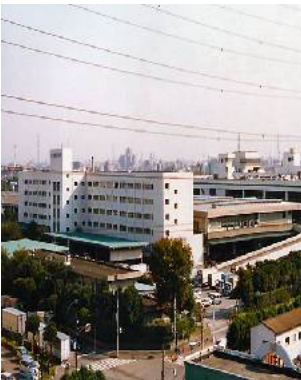
寮から望む北足立市場