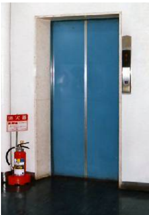
エレベータホール