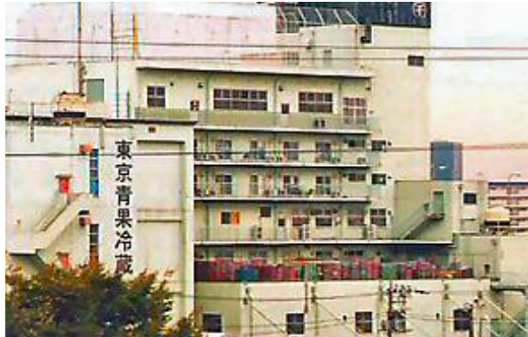
北足立市場より徒歩3分