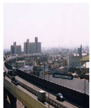
寮から望む首都高速